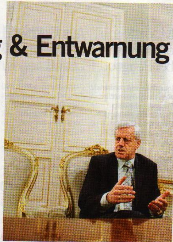
MAHNER. Für VfGH-Präsident G. Holzinger ist Datenspeicherung eine heikle Materie, mit der umsichtig umgegangen werden muss.

Auch wenn die Verfassungsrichter in dem Gesetz keine Grundlage für unzulässige Datenspeicherung sehen können, eine Rüge des Gesetzgebers für das Zustandekommen des Sicherheitspolizeigesetzes gibt es allemal: Der Gesetzgeber habe mit diesem Bereich